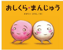
おしくら まんじゅう