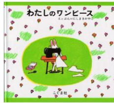
わたしの ワンピース