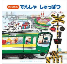
わくわく でんしゃ しゅっぱつ